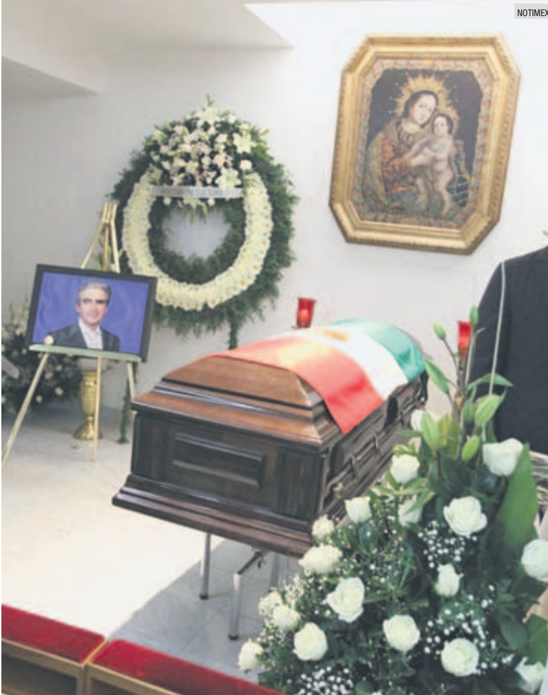
LUTO. Los amigos más allegados a la familia Tovar llegaron al Panteón Francés.