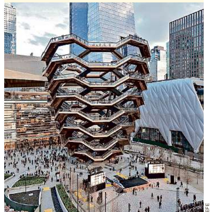
"The Vessel" está integrada por 2 mil 500 peldaños y tiene más de 45 metros de altura.

En el momento de la inauguración de Hudson Yards, "The Vessel", que costó 200 millones de dólares, se presentó como una de las piezas centrales del calificado como el proyecto urbanístico privado más grande de la historia de Estados Unidos y que supuso una inversión de 25 mil millones de dólares.